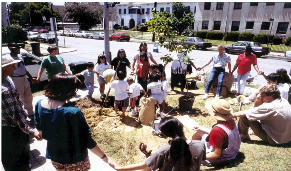
Εικόνα 1: Πρώτη δενδροφύτευση στο οικοχωριό, Απρίλιος 1993.

ηλεκτρονική αναφορά και τη μαζική συμμετοχή σε δημόσιες ακροάσεις για να προσελκύσει την προσοχή τοπικών εκλεγμένων αξιωματούχων, πείθοντας τελικά το LAUSD να επιλέξει έναν εναλλακτικό χώρο, ένα τετράγωνο προς τα βόρεια (Boyer 2014).