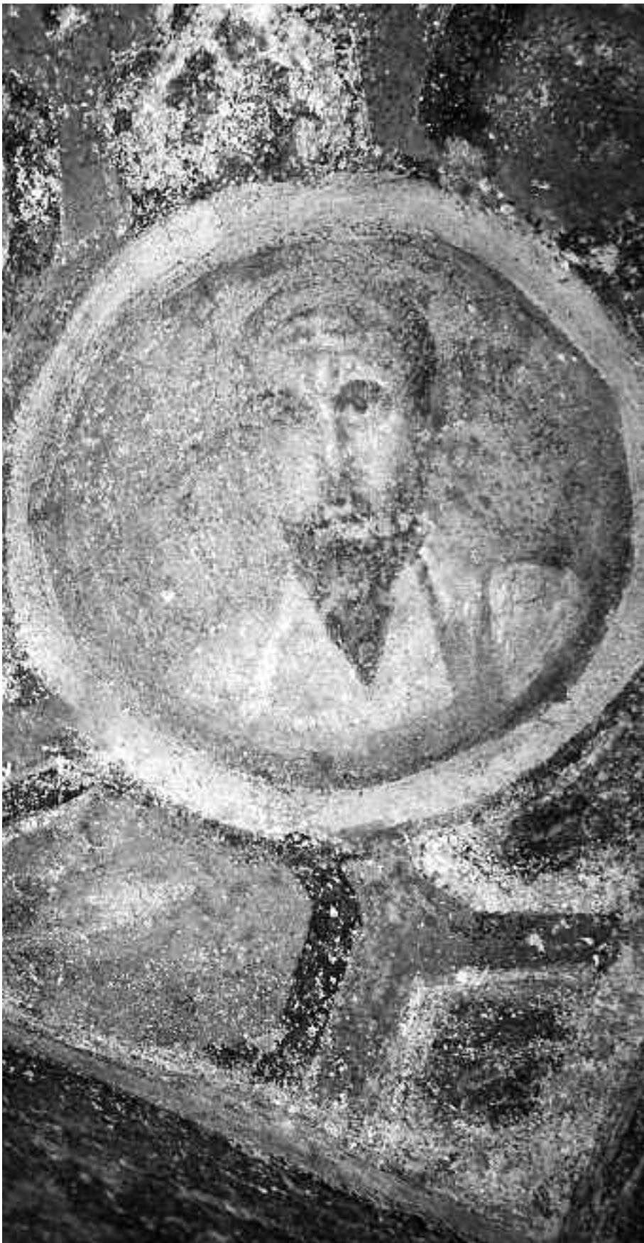
Μία από τις αρχαιότερες εικόνες του Αποστόλου Παύλου, που βρίσκεται στις catacumbes της Ρώμης.

Του πρωτοπρεσβύτερου Ιωάννη Σκιαδαρέση επίκ. καθηγητή της Θεολογικής σχολής ΑΠΘ