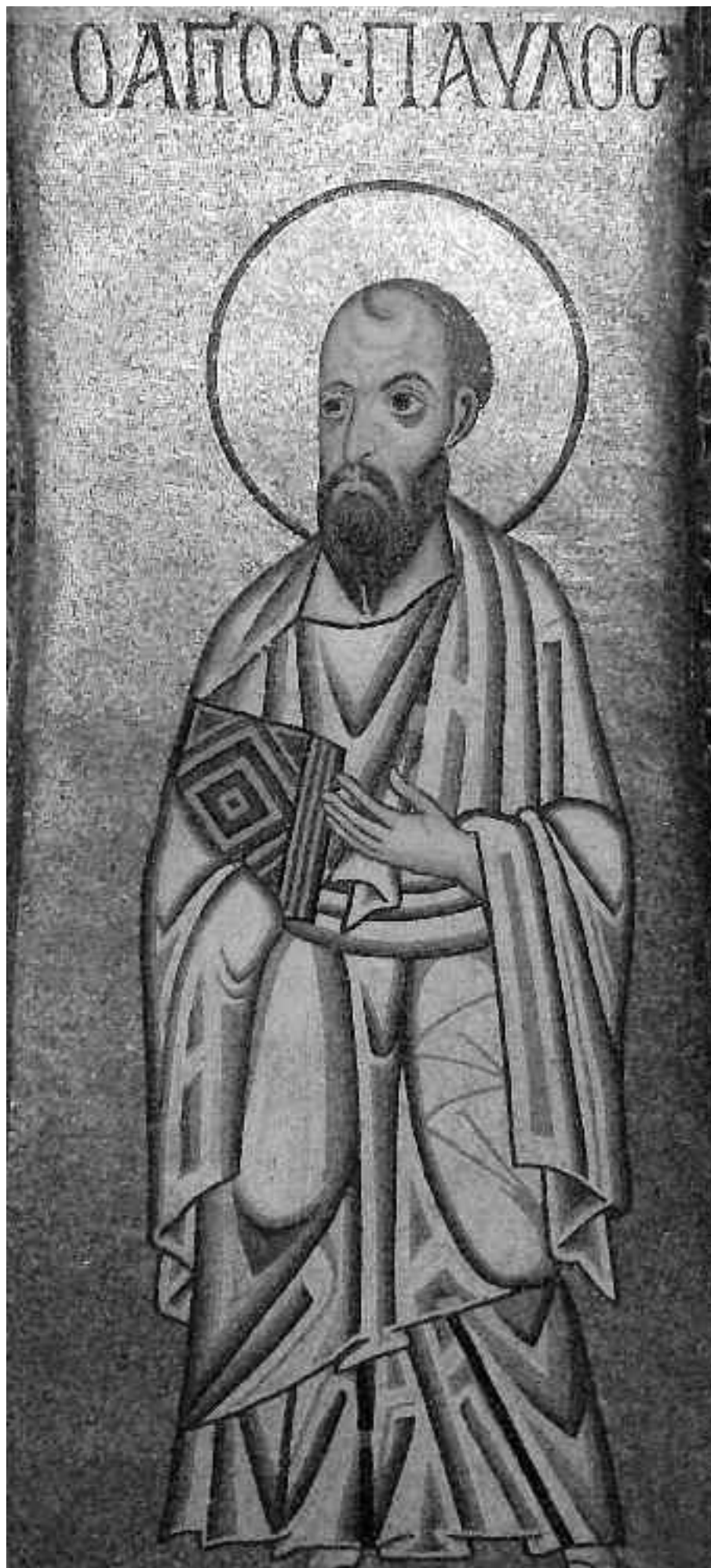
Ο Απόστολος Παύλος, ψηφιδωτό από την ιερή μονή Οσίου Λουκά.

ακό του περιβάλλον, με την αυστηρή προσήλωση στις πατροπαράδοτες παραδόσεις, αλλά και από την ιουδαϊκή κοινότητα της Ταρσού. Όλα τα προηγούμενα υπήρξαν καθοριστικοί παράγοντες της βαθιάς ρίζας του μεγάλου αποστόλου, της ιουδαϊκής, η αγνόηση της οποίας αποκλείει παντελώς την κατανόησή του. Άλλωστε, δεν πρέπει ούτε για στιγμή να ξεχνούμε ότι ο Παύλος προσεγγίζει τη Γραφή αλλά και γράφει ως ραββίνος.