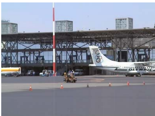
Φωτογραφία 1: Εφαρμογή microsurfacing με σκωρία τύπου II (αεροδρόμιο Θεσ/νίκης 2004)

Ήδη στον Ελλαδικό χώρο το σύστημα microsurfacing με σκωρία έχει εφαρμοσθεί με επιτυχία σε διάφορα αεροδρόμια (Χανίων, Πάρου, Θεσ/νίκης) αλλά και σε αυτοκινητοδρόμους (ΕΓΝΑΤΙΑ ΟΔΟΣ). Τα ειδικά χαρακτηριστικά της σκωρίας, η καλή συνεργασία με το τροποποιημένο με πολυμερή ασφαλτικό γαλάκτωμα δίνουν μίγματα με υψηλούς δείκτες αντιολίσθησης. Μετρήσεις με το Βρετανικό εκκρεμές[ASTM E 303] έδειξαν τιμές αντίστασης σε ολίσθηση(SRV) άνω του 60 ύστερα από 6 μήνες από την εφαρμογή microsurfacing με σκωρία. Στις φωτογραφίες 1 και 2 φαίνονται σχετικά παραδείγματα εφαρμογών.