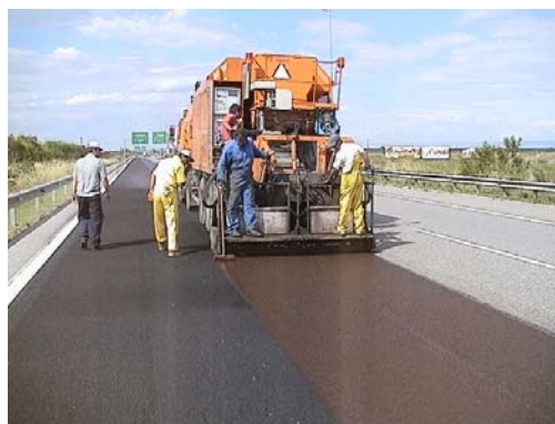
Φωτογραφία 2: Εφαρμογή microsurfacing με σκωρία τύπου III (ΠΑΘΕ, 460 ο χλμ Ε.Ο.Αθήνα- Θεσ/νίκης 2005)