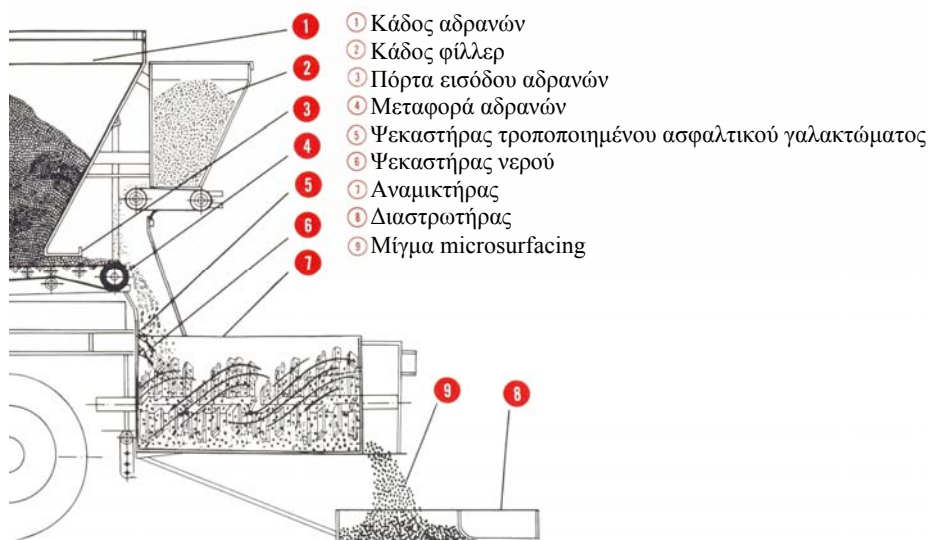
Σχήμα 1: Ανάμιξη και διάστρωση ψυχρού ασφαλτομίγματος

Η μέθοδος microsurfacing αναφέρεται στην εφαρμογή ενός ψυχρού ασφαλτομίγματος με συστατικά τροποποιημένο πολυμερές ασφαλτικό γαλάκτωμα, αδρανή, φίλλερ, νερό και κάποια πρόσμικτα. Το ειδικό αυτό ψυχρό ασφαλτόμιγμα με τις κατάλληλες αναλογίες των συστατικών του αναμιγνύεται και διαστρώνεται στην υπάρχουσα επιφάνεια εν κινήσει(σχήμα 1). Το όλο σύστημα μπορεί να επιτρέψει την κυκλοφορία ύστερα από πολύ σύντομο χρονικό διάστημα ανάλογα με τις καιρικές συνθήκες(20-60 λεπτά της ώρας).