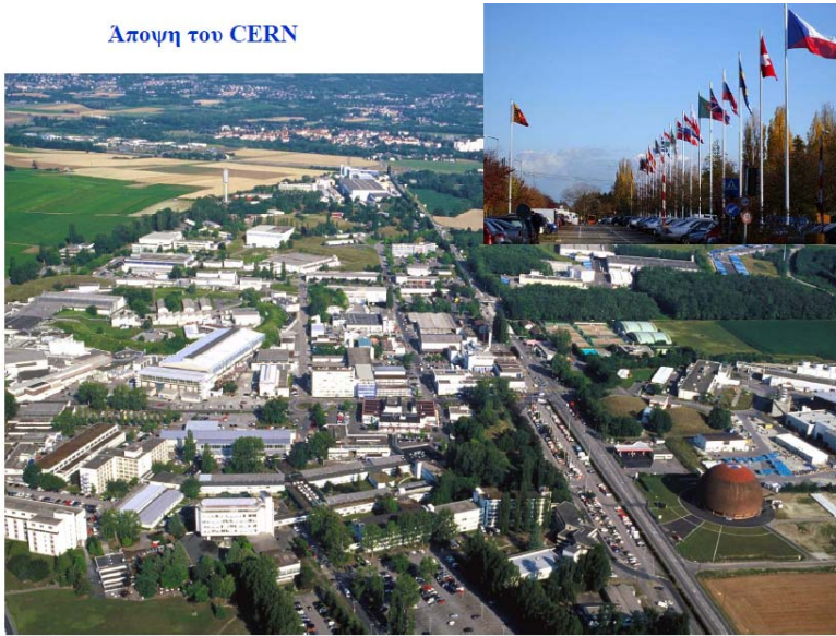
Εικόνα 1 Μια γενική άποψη του CERN

Στην εικόνα 2 δίδεται μια περίληψη της ιστορίας της Δημιουργίας σύμφωνα με την σύγχρονη επιστήμη. Αξίζει να σημειωθεί ότι μέχρι περίπου το 1920 η επιστήμη πίστευε ότι το Σύμπαν ήταν άναρχο. Ότι ο χώρος είναι αιώνιος και η ύλη κατασκευάστηκε μέσα σ' αυτόν.