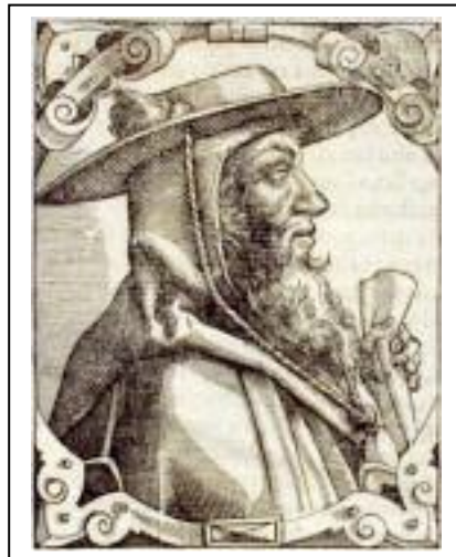
Καρδινάλιος Βησσαρίωνας (1403-1472)

ώθηση της αναγεννησιακής παιδείας 9 . Έτσι για παράδειγμα η ανυπαρξία οποιασδήποτε συμμετοχής ελλήνων στη μελέτη και μετάφραση των έργων του Ευκλείδη και του Αρχιμήδη ιταλικών κύκλων της εποχής, υποδηλώνει το έλλειμμα της μαθηματικής τους παιδείας κι αυτό γιατί η σχετική διαπραγμάτευση απαιτούσε εκτός από καλή γνώση της ελληνικής και λατινικής γλώσσας κι ένα υψηλό επίπεδο μαθηματικής μόρφωσης, συνδυασμός μάλλον δυσεύρετος μεταξύ των ιταλών ουμανιστών του 15ου αιώνα. Κι αυτό φαίνεται από την επιλογή του γερμανού Regiomontanus [Johannes Muller (1436-1476)] από τον έλληνα καρδινάλιο Βησσαρίωνα, γύρω στο 1460 μ.Χ., για τη σπουδή και μετάφραση των αρχαίων ελληνικών μαθηματικών χειρογράφων του 10 , αλλά και από την επισήμανση, το 1530 περίπου, του Φραγκίσκου Μαυρόλυκου, με αφορμή την ανεπάρκεια της πρώτης λατινικής έκδοσης των «Στοιχείων» του Ευκλείδη μεταφρασμένα από τα ελληνικά, το 1505, ότι καλές νέες μεταφράσεις των ελληνικών μαθηματικών πρέπει να στηριχθούν πάνω σε εξασφαλισμένη γνώση και των ελληνικών και των μαθηματικών 11 . Όλα αυτά υποδεικνύουν ότι και οι «ελληνιστές» στερούνταν μαθηματικής μόρφωσης και ζήλου, που ίσως να οφείλεται σε παραμέληση ή και ανεπάρκεια των πρωτοπόρων τους να καλλιεργήσουν και να παρακινήσουν το ενδιαφέρον για τα μαθηματικά.