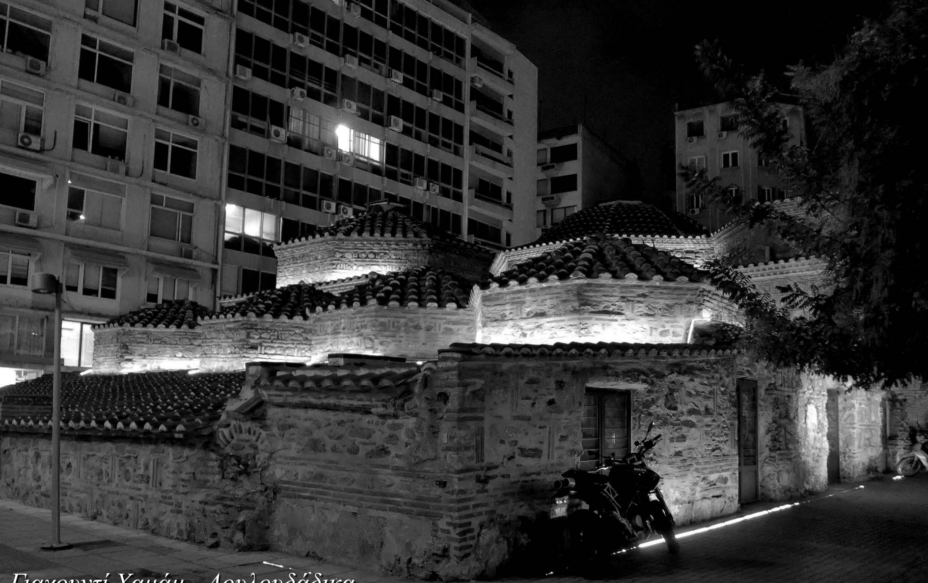
Γιαχουντί Χαμάμ - Λουλουδάδικα