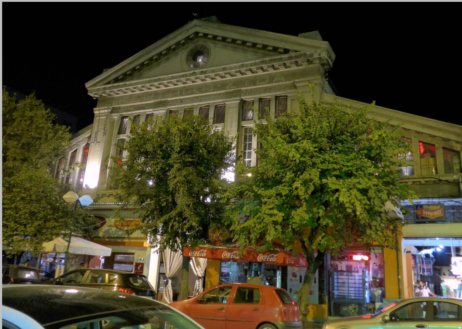
Κεντρική Αγορά, Μοδιάνο