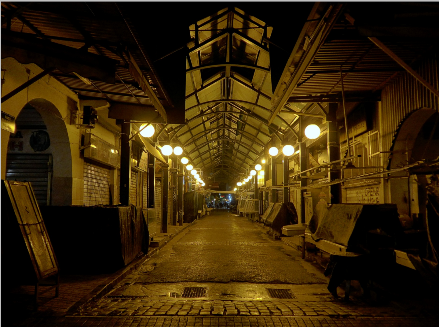
Αγορά Βλάλη, Καπάρι