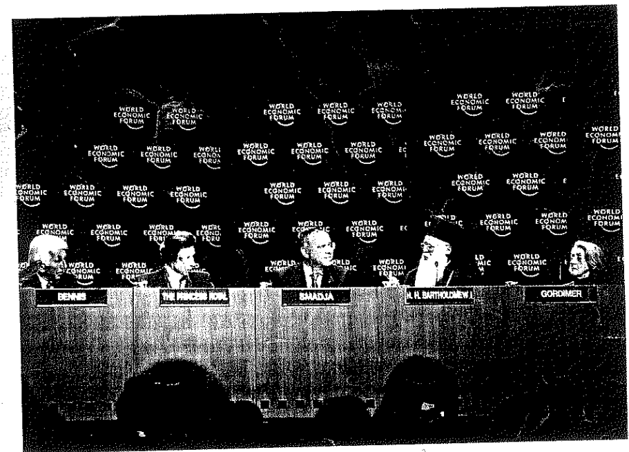
Ἡ Α.Θ.Π., ὁ Πατριάρχης εἰς τὸ Παγκόσμιον Οἰκονομικόν Forum τοῦ Davos

Ἡ Α.Θ. Παναγιότης, ὁ Πατριάρχης, ἐπέστρεψεν εἰς τὴν ἔδραν Αὐτοῦ τὸ ἑσπέρας τῆς Κυριακῆς, 7ης Φεβρουαρίου.