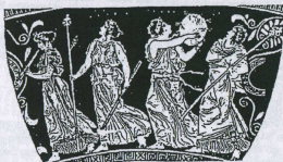
Εικ. 79. (Κάτω.) Στην ίδια στήλη από τη Νεσέολη φαίνονται μαινάδες σε νυχτερινό ενθουσιαστικό χορό στο ύπαιθρο (κισσοστεφανωμένες, με τύμπανο, αυλό, θύρσους και δόδες).