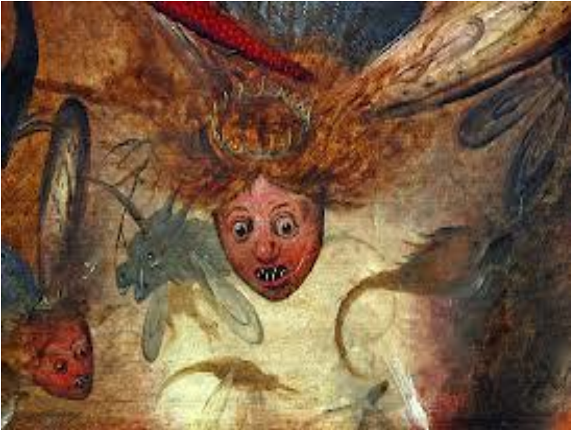
Pieter Bruegel, The fall of the rebel angels (detail, 1562)

Ερμηνευτικές και διεπιστημονικές προσεγγίσεις