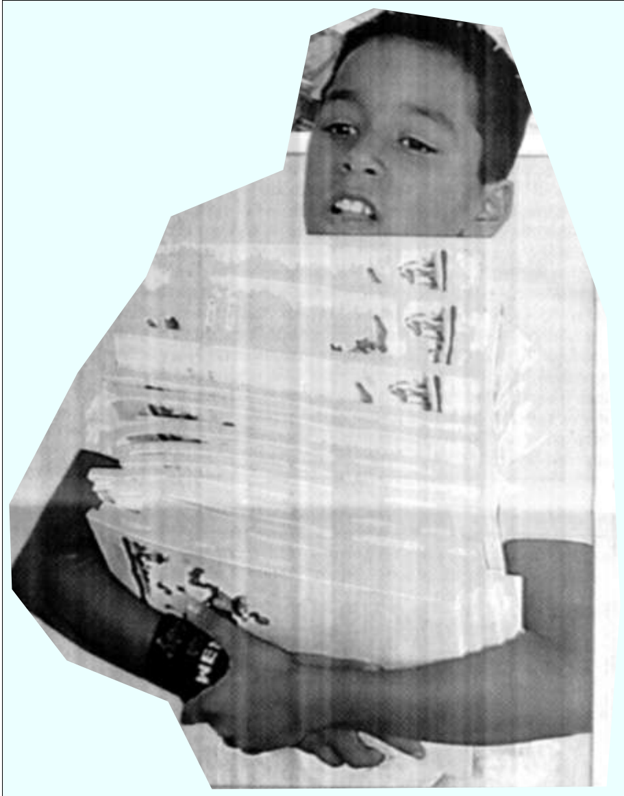
ΦΙΛΕΛΕΥΘΕΡΟΣ Κυριακή, 30 Νοέμβριος 2008, π. 44