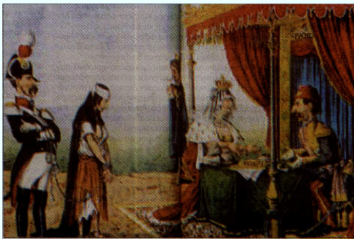
Δημιουργία αρχείου ιστορικών πηγών για τα κρίσιμα ζητήματα της σύγχρονης Ιστορίας